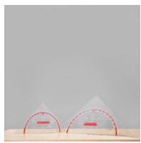
Geodreieck, Geometrie-Dreieck der Serie Profi Linie