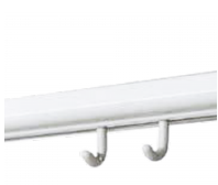
Galeriehaken für 2-Kanal Schiene MediaRail 2