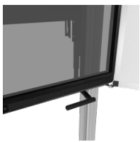
Griff zur Bedienung eines