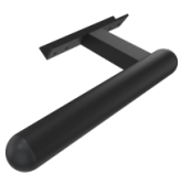
Griff zur Bedienung