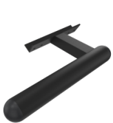
Griff zur Bedienung