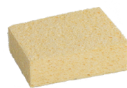
Tafelschwamm, feinporig, saugstark und reißfest