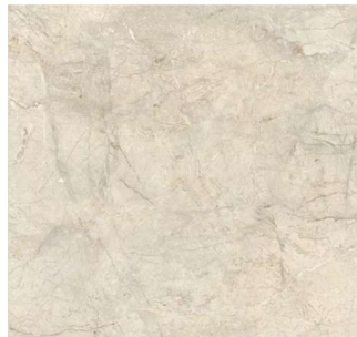
San Luca Marmor F108 ST9