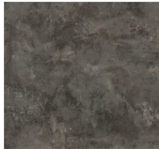
Metal Rock anthrazit F121 ST87