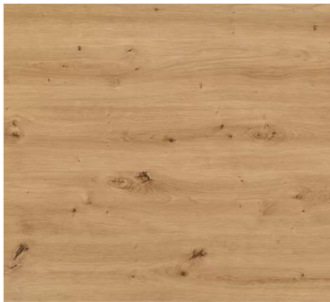
Wildeiche natur H1318 ST10

38 MM DICKE ARBEITSPLATTE MIT RUNDKANTE UND WIDERSTANDSFÄHIGER BESCHICHTUNG ZUR AUSSTATTUNG VON ARBEITSFLÄCHEN