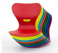
Farben für unsere ergonomischen Kunststoffschalen