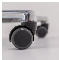
Fußkreuz mit Rollen