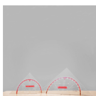
Geodreieck, Geometrie-Dreieck der Serie Profi Linie