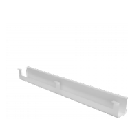
Kabelkanal mit Durchlassbohrung an der Platte für höhenverstellbare Tische Modell EHC