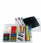
Zubehörsatz für Projektplaner