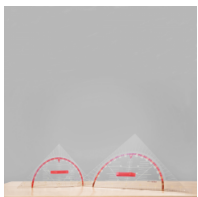
Geodreieck, Geometrie-Dreieck der Serie Profi Linie