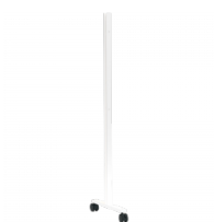
1 Paar Paneelbefestigung SOLIDO M