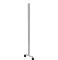
1 Paar Paneelbefestigung SOLIDO M