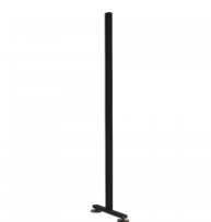
1 Paar Paneelbefestigung SOLIDO M