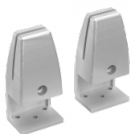
SOLIDO V Tischklemmen, einseitig