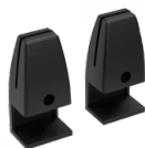
SOLIDO V Tischklemmen, einseitig