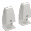
SOLIDO V Tischklemmen, einseitig