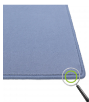
Ketteln von Vorwerk-Spielteppich