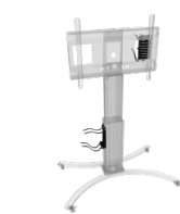
Universalhalterung für PCs