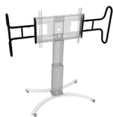
Zwei große, stabile Griffe