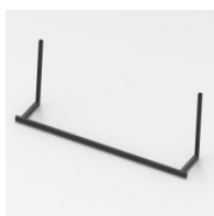
Griff für 86" Display